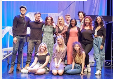
Myfyrwyr Stondin Efrog Newydd.

Yn dilyn ein Gala Efrog Newydd ar gyfer Catherine Zeta-Jones ar Ddydd Gŵyl Dewi, roedd y Coleg yn ôl ym mwrlwm byd theatr America ar gyfer ei Stondin UDA flynyddol yn Theatr Signature ar 42nd Street. Mae'r digwyddiad erbyn hyn yn ei bedwaredd flwyddyn ac mae'n gweithredu fel sbringfwrdd i'r diwydiant, gan roi cyfle i'n graddedigion actio a theatr gerddorol o America a Chanada berfformio gerbron asiantau, rheolwyr, cyfarwyddwr castio a gwahoddedigion o'r diwydiannau adloniant yn America.